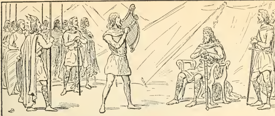
Alfred entra dans leur camp sous l'habit d'un joueur de harpe. (page 18)